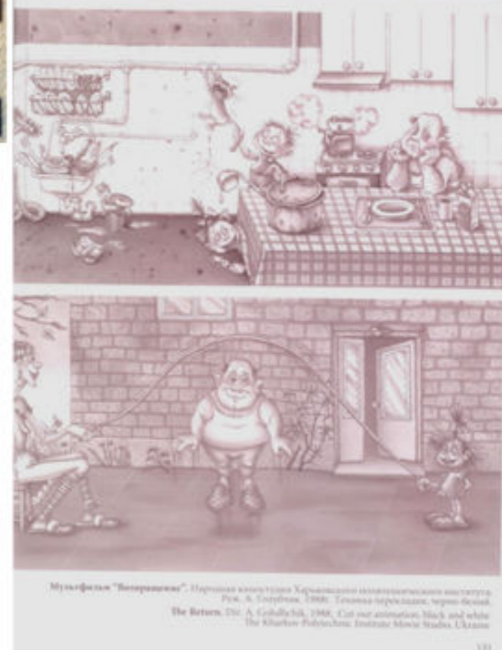
Мультифільм "Возвращение". Пародія на кінострічку Харківського інституту театрознавства ім. А. Сухомлина, 1980. Техніка перекладки, чорно-білий. The Return. Dir. A. Golubchik, 1980. Cut-out animation, black and white. The Kharkov Polytechnic Institute Movie Studio, Ukraine.